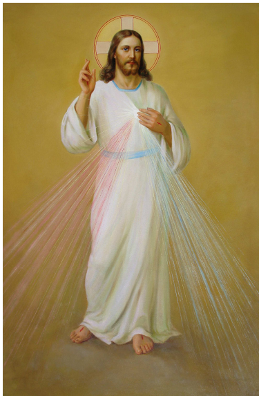
Imagen de la Divina Misericordia

En la tarde de aquel día, el primero de la semana, y estando los discípulos con las puertas cerradas por miedo a los judíos, llegó Jesús, se puso en medio y les dijo: «¡La paz esté con vosotros!». Y les enseñó las manos y el costado. Los discípulos se llenaron de alegría al ver al Señor. Él repitió: «¡La paz esté con vosotros! Como el Padre me envió a mí, así os envío yo a vosotros». Después sopló sobre ellos y les dijo: «Recibid el Espíritu Santo. A quienes perdonéis los pecados, les serán perdonados; a quienes se los retengáis, les serán retenidos». Tomás, uno de los doce, a quien llamaban «el Mellizo», no estaba con ellos cuando llegó Jesús. Los otros discípulos le dijeron: «Hemos visto al Señor». Él les dijo: «Si no veo en sus manos la señal de los clavos y no meto mi dedo en el lugar de los clavos y la mano en su costado, no lo creo». Ocho días después, estaban nuevamente allí dentro los discípulos, y Tomás con ellos. Jesús llegó, estando cerradas las puertas, se puso en medio y les dijo: «¡La paz esté con vosotros!». Luego dijo a Tomás: «Trae tu dedo aquí y mira mis manos; trae tu mano y métela en mi costado, y no seas incrédulo sino creyente». Tomás contestó: «¡Señor mío y Dios mío!». Jesús dijo: «Has creído porque has visto. Di-